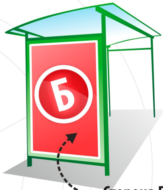
Сторона Б 1,2 x 1,8м / 1 x 1,5м